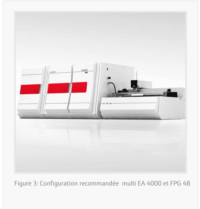
Figure 3: Configuration recommandée multi EA 4000 et FPG 48

Il est particulièrement robuste et ne demande que peu d'entretien tout en étant très simple d'utilisation, quel que soit le niveau de compétence de l'opérateur et l'environnement du laboratoire. De plus, la cellule à haute concentration permet une gamme de fonctionnement extrêmement large jusqu'à 10% Cl (en mode split). Cl (in split mode).